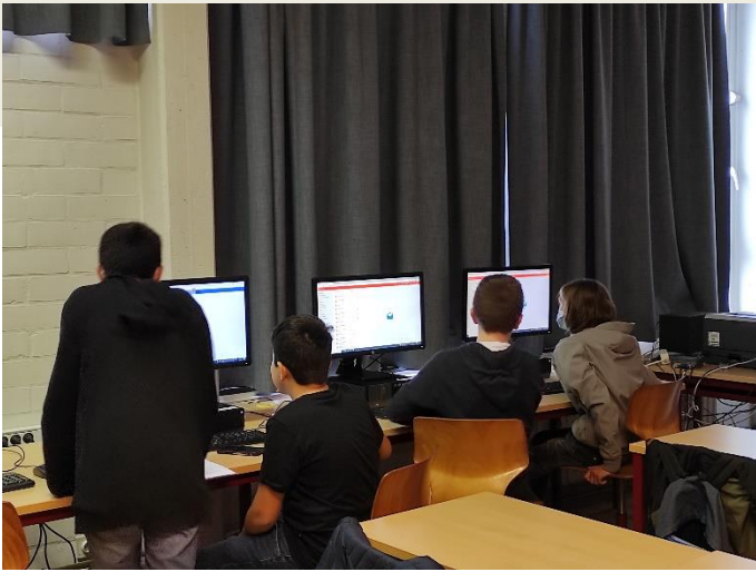
Aan het werk