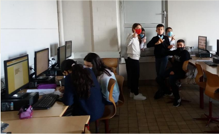
Aan het werk